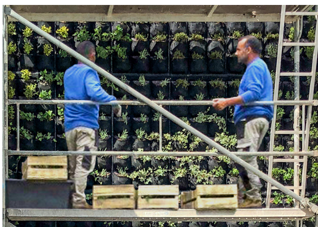
individuelle Bepflanzung auf Anfrage

Häufig bieten Wohnbereiche, Büros, Praxen, Ladengeschäfte oder Salons nicht genügend Fläche für eine spürbare Innenraumbegrünung. Aus diesem Grund hat art aqua eine patentierte Methode entwickelt, um Pflanzen auf vertikalen Böden wachsen zu lassen. Dies hat den Vorteil, dass die so geschaffenen Grünflächen viel größer und effektiver sind, als ihr jeweiliger Platzbedarf. So werden Raumteiler oder Wände zu Indoor-Grünanlagen und Räume zu atmenden Zonen. Die messbare Verbesserung des Raumklimas wirkt positiv auf Körper und Geist. Zudem werden Schadstoffe gefiltert und in Sauerstoff umgewandelt.