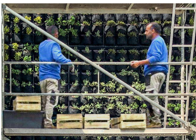
individuelle Bepflanzung auf Anfrage

Häufig bieten Wohnbereiche, Büros, Praxen, Ladengeschäfte oder Salons nicht genügend Fläche für eine spürbare Innenraumbegrünung. Aus diesem Grund hat art aqua eine patentierte Methode entwickelt, um Pflanzen auf vertikalen Böden wachsen zu lassen. Dies hat den Vorteil, dass die so geschaffenen Grünflächen viel größer und effektiver sind, als ihr jeweiliger Platzbedarf. So werden Raumteiler oder Wände zu Indoor-Grünanlagen und Räume zu atmenden Zonen. Die messbare Verbesserung des Raumklimas wirkt positiv auf Körper und Geist. Zudem werden Schadstoffe gefiltert und in Sauerstoff umgewandelt.